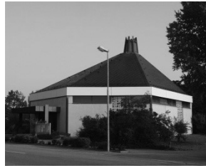
Kapelle St. Josef Marktplatz 31 68723 Schwetzingen- Hirschacker