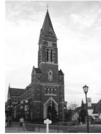
Pfarrkirche St. Nikolaus Schwetzingener Str. 34 68723 Plankstadt