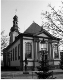
Pfarrkirche St. Pankratius Schlossstr. 8 68723 Schwetzingen