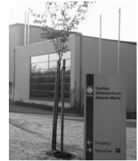
Kapelle im Caritas- Altenzentrum (CAZ) Sancta Maria Schönauer Straße 2 68723 Plankstadt