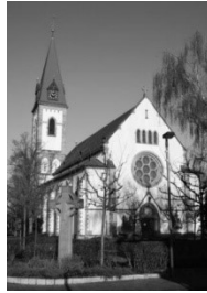
Pfarrkirche St. Kilian Mozartstr. 1 68723 Oftersheim