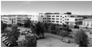
Kapelle im GRN Kreiskrankenhaus Bodelschwinghstr. 10 68723 Schwetzingen