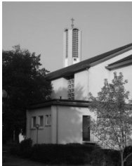
Kirche St. Maria Hans-Thoma-Str 3 68723 Schwetzingen