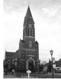
Pfarrkirche St. Nikolaus Schwetzingener Str. 34 68723 Plankstadt