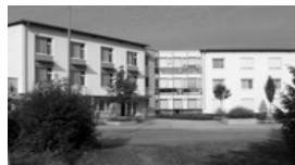
Kapelle im GRN Seniorenzentrum Bodelschwingerstr. 10/1 68723 Schwetzingen