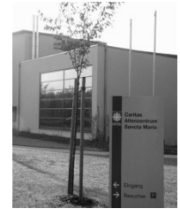
Kapelle im Caritas- Altenzentrum (CAZ) Sancta Maria Schönauer Straße 2 68723 Plankstadt