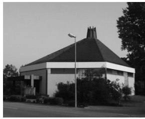
Kapelle St. Josef Marktplatz 31 68723 Schwetzingen- Hirschacker