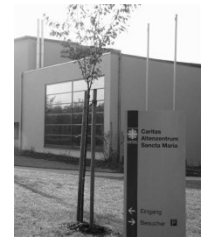
Kapelle im Caritas- Altenzentrum (CAZ) Sancta Maria Schönauer Straße 2 68723 Plankstadt